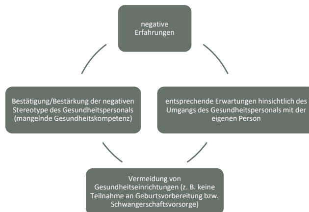
Abbildung 3.2: Negative Spirale in der Geburtsvorbereitung von Romnja