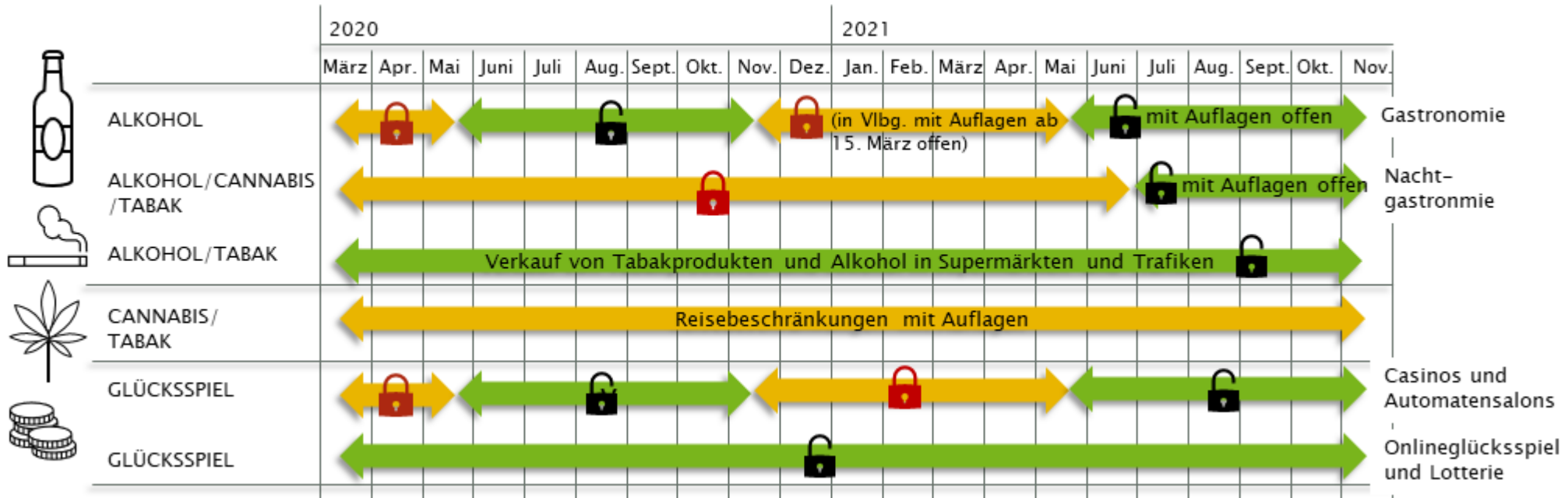
Darstellung: Bachmayer 2021