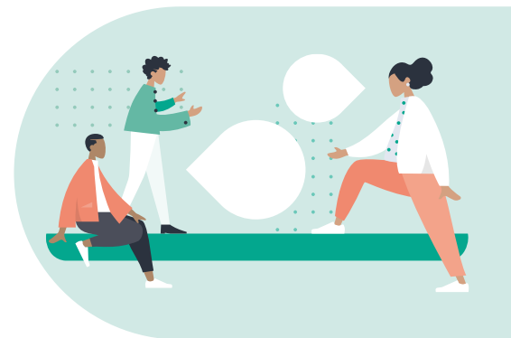
Illustration: M. Drechsler