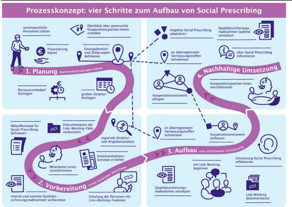
Abbildung 3: Prozesskonzept zum Aufbau von Social Prescribing

Die nachfolgenden Schritte des Prozesskonzepts (vgl. Abbildung 3) geben eine Orientierung, wie Social Prescribing in einer Primärversorgungseinrichtung etabliert werden kann. Grundlagen hierfür bilden das Prozesskonzept zur Umsetzung von Social Prescribing (Haas 2020) und die Umsetzungserfahrungen im Rahmen des Projektcalls „Social Prescribing in der Primärversorgung“. Die jeweiligen Umsetzungsschritte werden nachfolgend in Kürze erläutert. Eine ausführliche Beschreibung des Prozesskonzepts findet sich im Handbuch „Social Prescribing in der Primärversorgung“ (Rojatz et al. 2025) (siehe auch Kapitel 6.3).